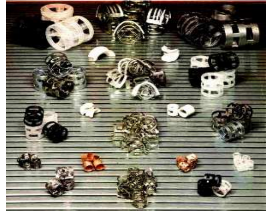
Tipos de Enchimento