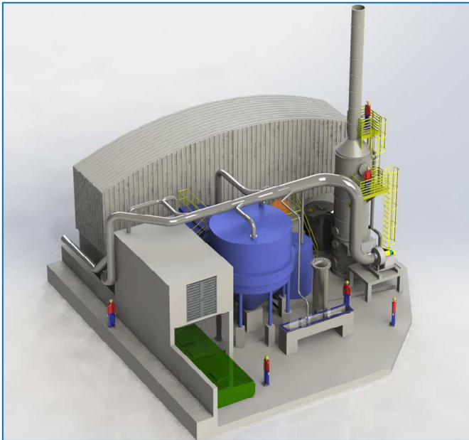
Lavador de Gases para Controle de Odor

ECO TECH SYSTEM CONTROLE AMBIENTAL LTDA. Rua José Versolato, 111, conj. 1508, Ed. Domo Business Centro - São Bernardo do Campo - SP | CEP 09750-730 Tel.: (11) 4337-4000 / Fax.: (11) 4121-8904 vendas@ecotechsystem.com.br